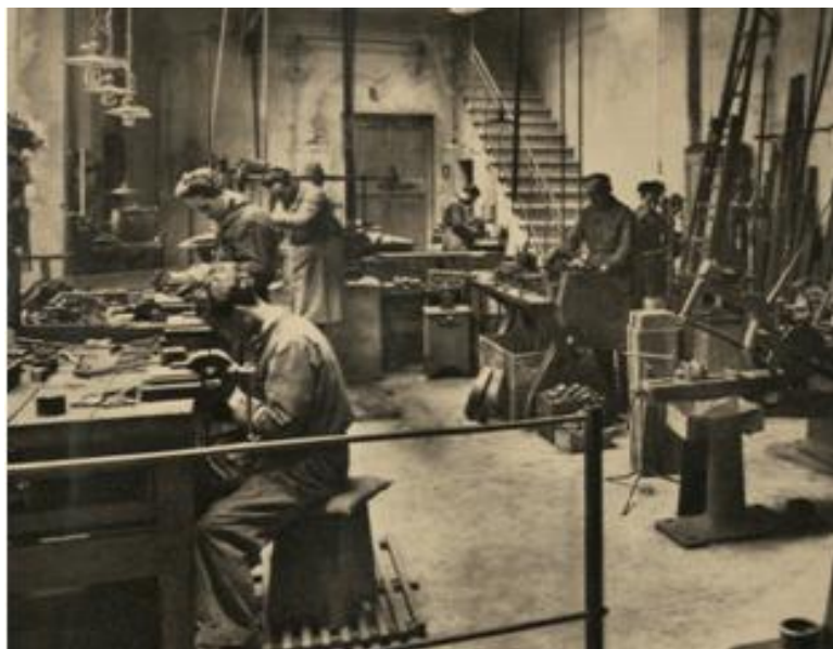
Un'immagine di un vecchio laboratorio meccanico per la costruzione di attrezzature orafe.